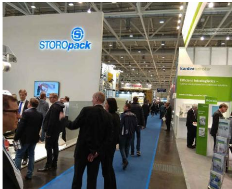
Promocja gospodarcza Bydgoszczy na targach CeMAT Hannover 2018